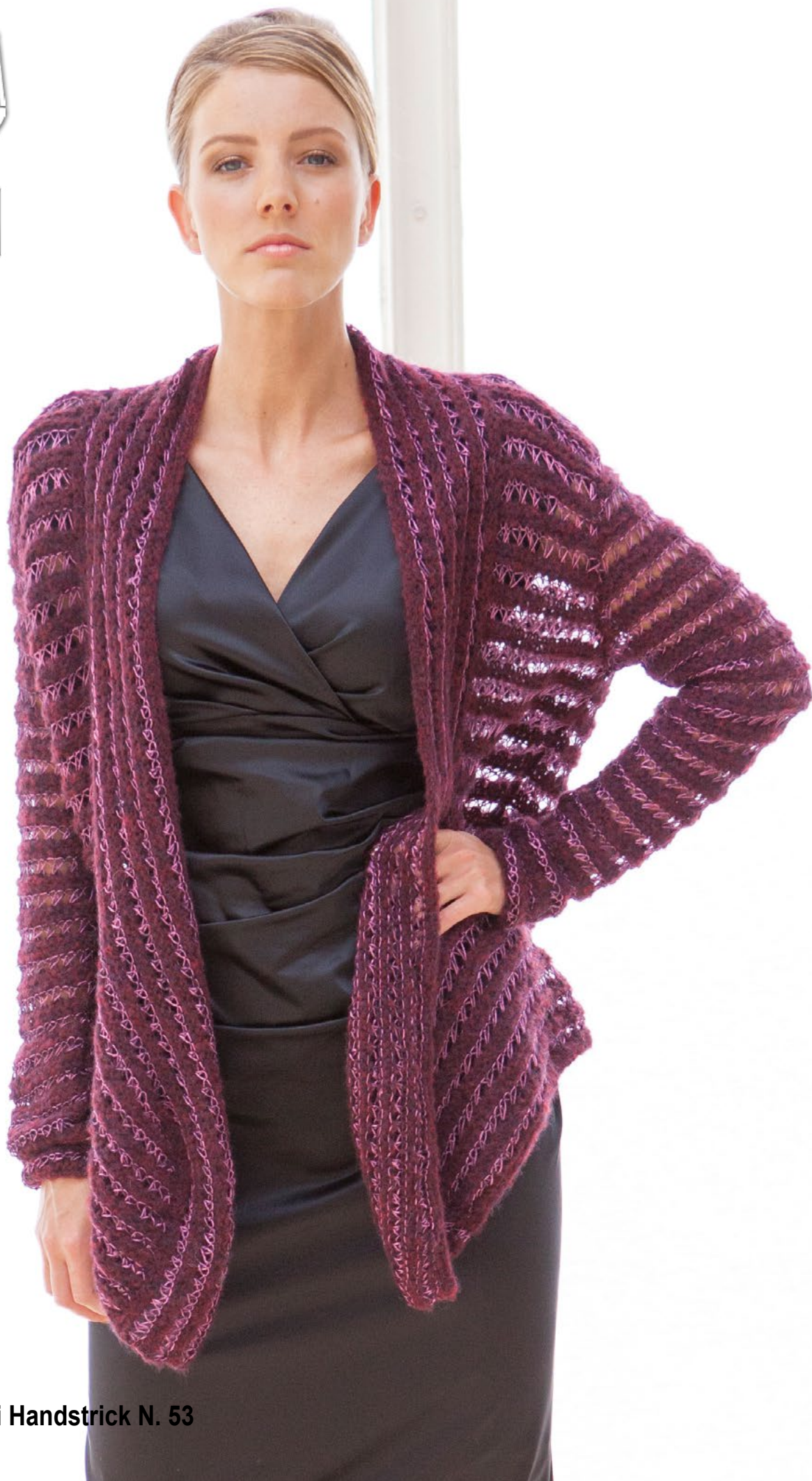
Модель 32 из журнала Filati Handstrick N. 53