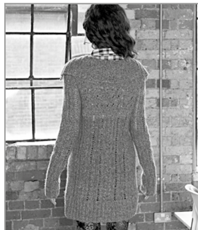
Модель 61 вид сзади

Сборка: детали расправить по выкройке, увлажнить и дать высохнуть. Выполнить швы, при этом первые 13 см швов рукавов выполнить для отворотов таким образом, чтобы после отворота шов находился на внутренней стороне. На круговые спицы № 4,5 набрать по вырезу горловины с лиц. стороны 64 п. и вязать воротник резинкой прямыми и обратными рядами, при этом в 1-м р. вязать тем не менее след. образом: кром., * 2 изн., 1 лиц., повторить от * 19 раз, 2 изн., кром. В след. 5-м ряду провязать петли по рисунку. В 7-м ряду воротника вывязать из каждой 2-й лиц. 1 лиц. и 1 лиц. скрещ. = 74 п. Такие прибавления повторить в 15-м ряду в пропущенных лиц. петлях = 84 п. Затем вязать по рисунку резинкой, при этом после 4-го ряда работу продолжить спицами № 5,5. На общей высоте воротника 16 (15) 16 см петли свободно закрыть по рисунку. Теперь по вертикальным краям полочек и коротким сторонам воротника набрать по 140 (140) 144 п. и вязать планки резинкой, при этом начинать с 1 изн. ряда и после кром. с 2 изн., в конце ряда заканчивать перед кром. 2 изн. На высоте планки 1,5 см выполнить в планке правой полочки 4 отверстия для пуговиц. Верхнее отверстие выполнить у начала кокетки, остальные 3 отверстия — через каждые 9 см под первым отверстием. Для каждого отверстия закрыть 2 п. и в след. ряду снова набрать по 2 п. На высоте планки 3 см все петли закрыть по рисунку. Втачать рукава. Низ рукавов отвернуть на 10,5 см на внешнюю сторону. Пришить пуговицы.